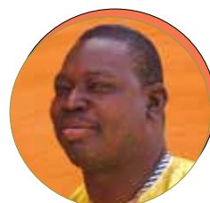
Hama GORO Tea Ceremony